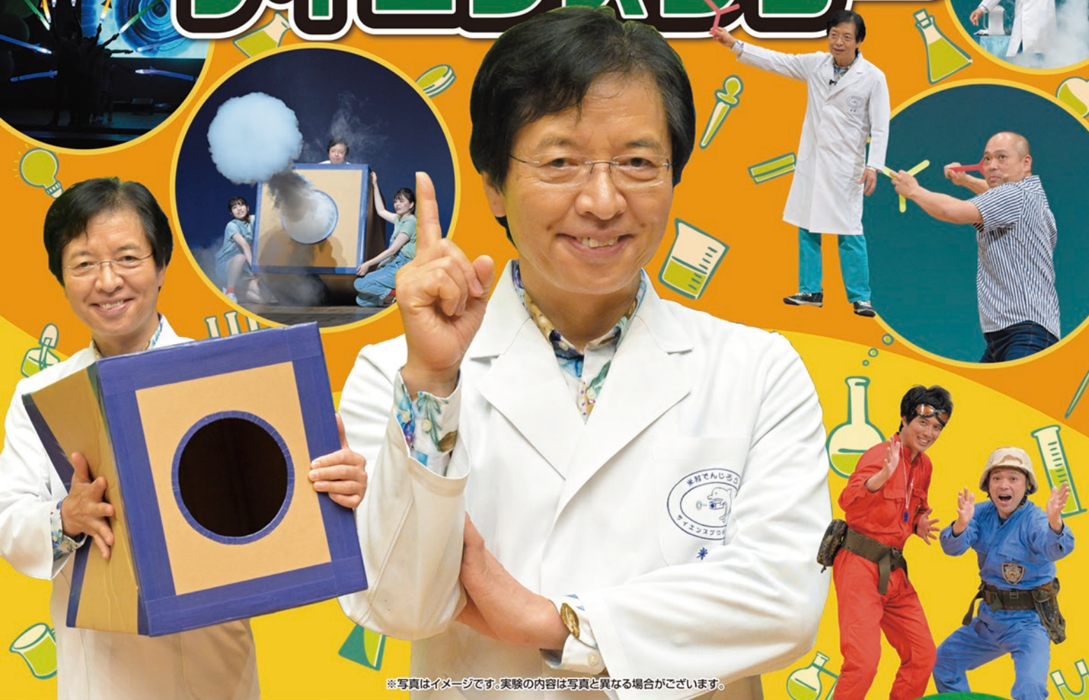
※写真はイメージです。実験の内容は写真と異なる場合がございます。