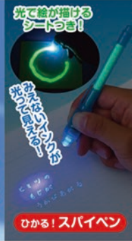
光で絵が描ける シートつき!