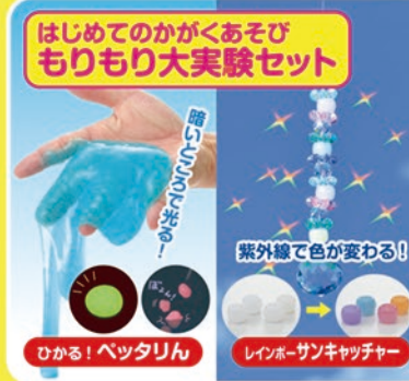
はじめてのかがかあそび もりもり大実験セット