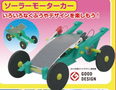
ソーラーモーターカー いろいろなくふうやデザインを楽しもう!

★★ 会場で販売をします。お楽しみに! ★★ ※商品に変更になる場合がございます。