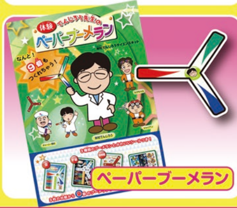
ペーパーブーメラン