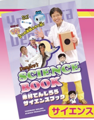
サイエンスブック