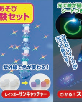
紫外線で色が変わる!